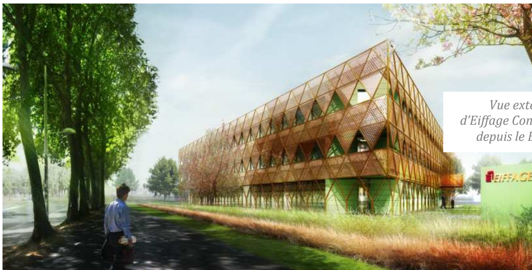
Vue extérieure du futur siège d'Eiffage Construction Nord Ouest depuis le Boulevard de Tournai