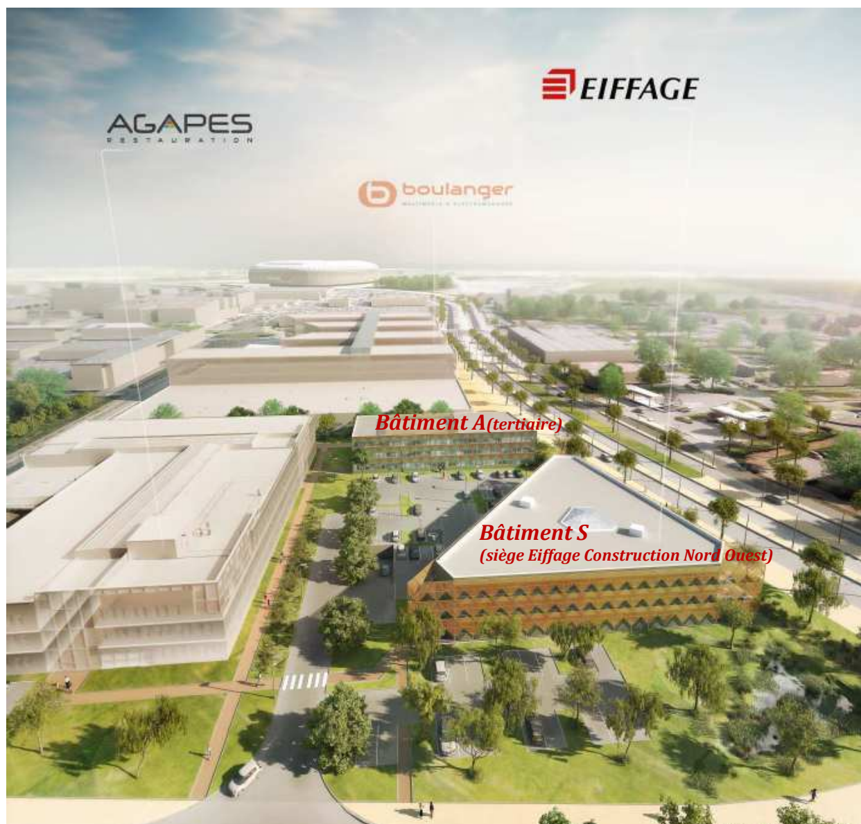
Le nouvel Eco-quartier tertiaire de Lezennes avec le Grand Stade de Lille en arrière-plan.

Le siège d'Eiffage Construction Nord Ouest s'inscrit dans une opération de promotion de deux immeubles de bureaux, certifiés HQE et BBC, construit sur un terrain de 8 200 m 2 .