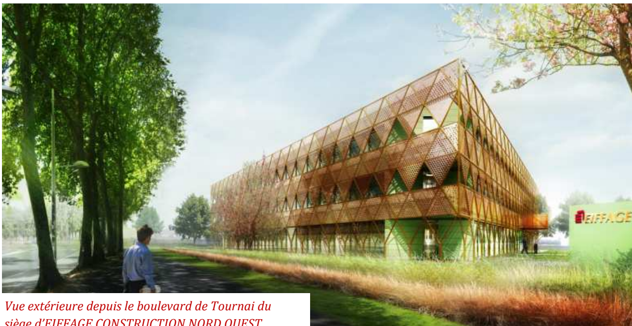
Vue extérieure depuis le boulevard de Tournai du siège d'EIFFAGE CONSTRUCTION NORD OUEST.

D'une superficie de 3 600 m 2 , le futur siège régional du leader du BTP accueillera 150 collaborateurs d'ici septembre 2014.