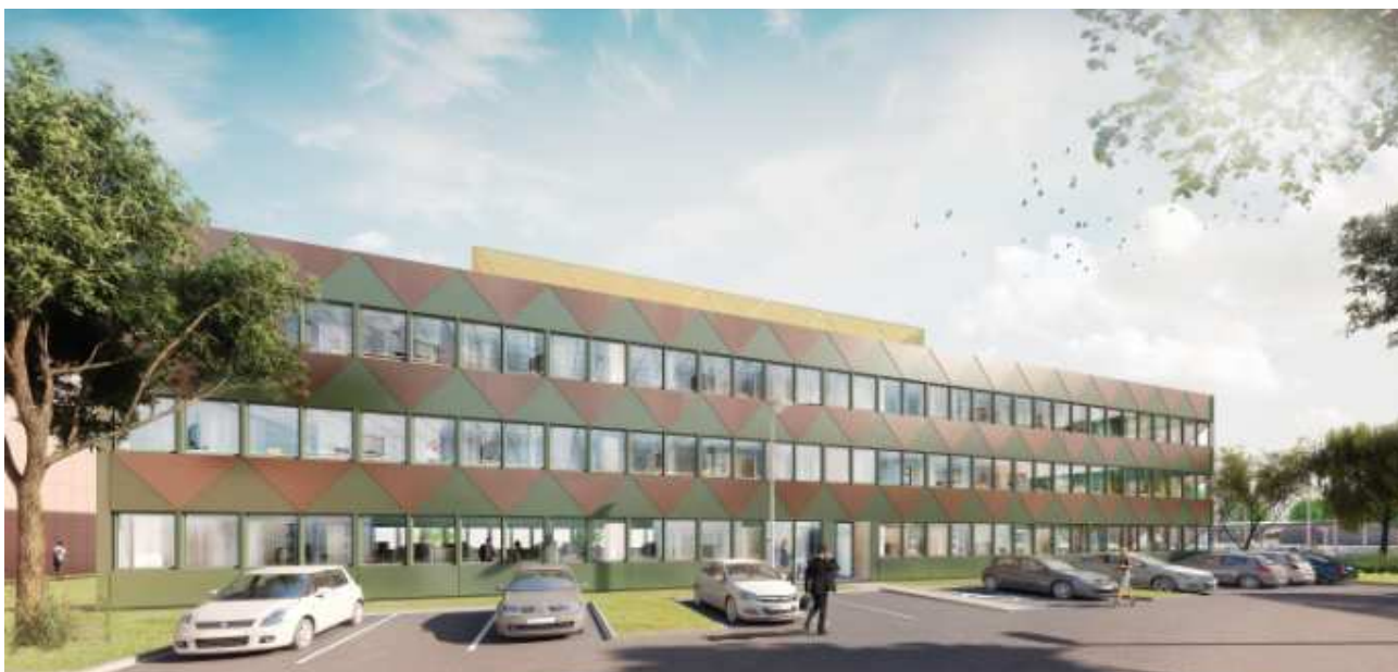
Vue extérieure du second bâtiment.

Le second bâtiment, d'une superficie de 2 400 m 2 , proposera des plateaux de bureaux à la location. Ces derniers ne sont pas encore commercialisés.